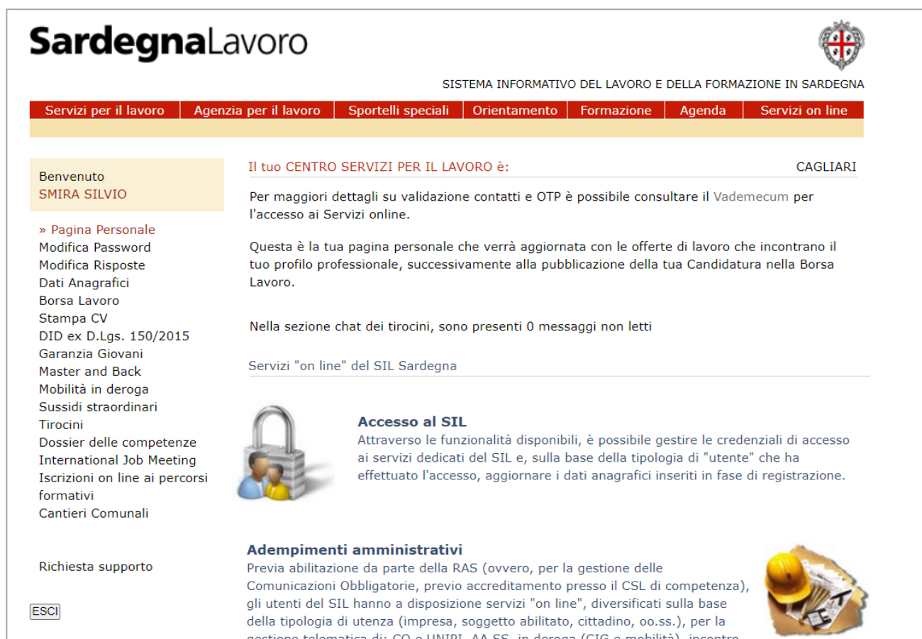
Figura 2: "Home page area riservata"

Per accedere ai servizi del portale pubblico, è sufficiente inserire nei campi evidenziati dal rettangolo rosso le proprie credenziali d'accesso ("User ID" e "Password") e selezionare il pulsante "LOGIN". Una volta effettuato il "login", il sistema visualizza la pagina personale del cittadino che ha effettuato l'autenticazione, così come mostrato nella figura sottostante: